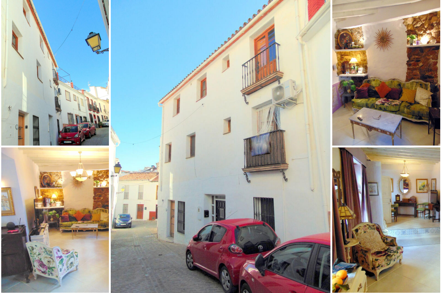
Tradicional Casa Adosada Andaluza en el Corazón de Monda – Ubicación Privilegiada en el Pueblo

Esta preciosa casa adosada de 3 dormitorios y 2.5 baños ofrece 159 m 2 construidos, combinando a la perfección el encanto rústico andaluz con un toque moderno. Situada a poca distancia a pie de todos los servicios, la vivienda se encuentra en el animado pueblo de Monda, conocido por su ambiente acogedor y su auténtico carácter andaluz. A menos de 15 minutos del centro comercial La Cañada en Marbella y a menos de 20 minutos de la playa, los puertos deportivos de Marbella o el Parque Natural de la Sierra de las Nieves, su ubicación ofrece comodidad y un estilo de vida excepcional.