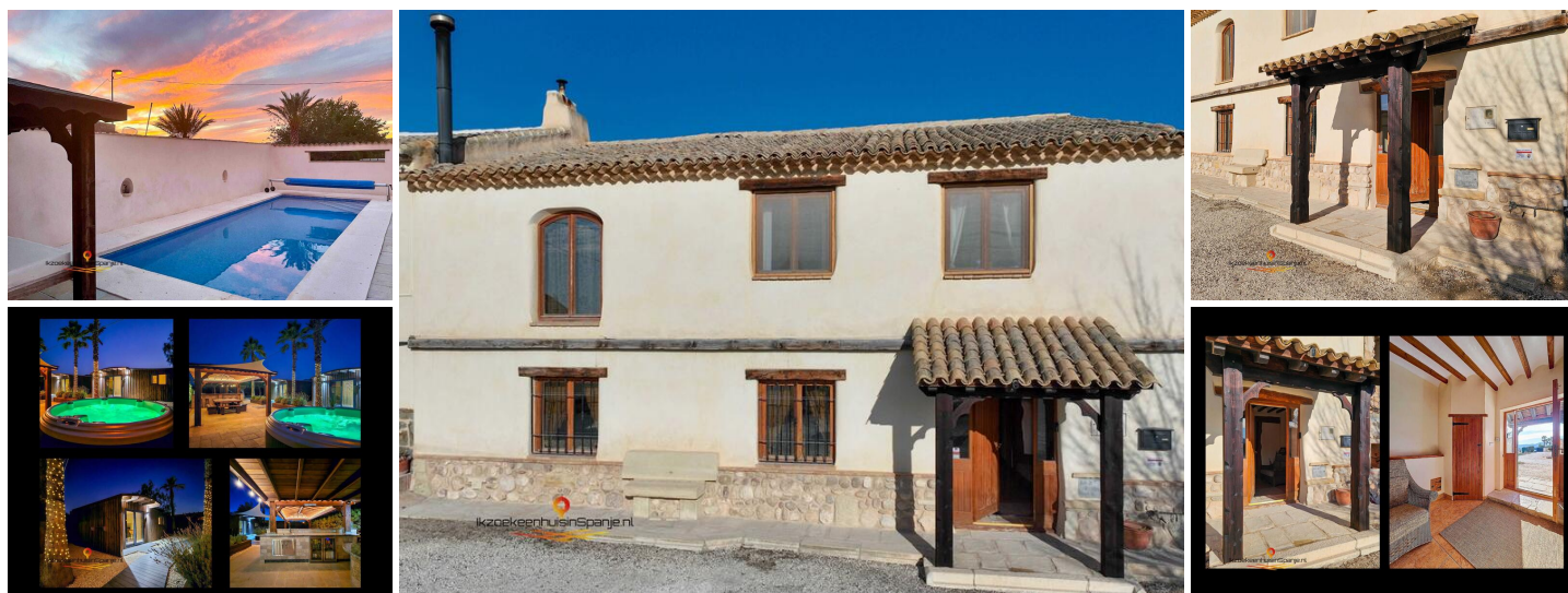
Casa de Pueblo con Encanto y 2 Chalets Adicionales para Alojamiento de Huéspedes

Casa de pueblo reformada con carácter, que mantiene elementos originales combinados con comodidades actuales. Además de la vivienda principal, se incluye una segunda parcela con posibilidad de alojamiento independiente para invitados.