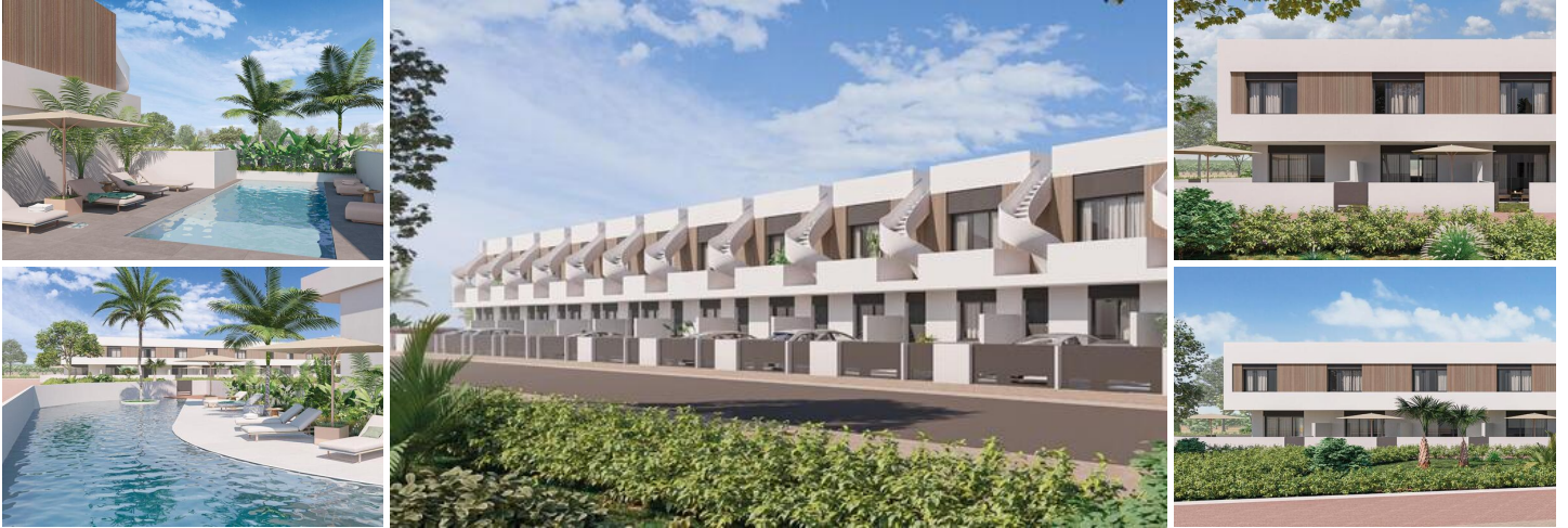
Casas adosadas y casas adosadas en esquina de nueva construcción en Pilar de la Horadada