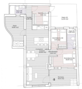
PLANTA I ID Sala 11.00 m 2 Sue. 10.00 m 2 Comedor 10.00 m 2 Cocina 6.00 m 2 Dormitorio 11.00 m 2 Dormitorio 11.00 m 2 Dormitorio 11.00 m 2 Baño 4.00 m 2 Sala 11.00 m 2 Sue. 10.00 m 2 Comedor 10.00 m 2 Cocina 6.00 m 2