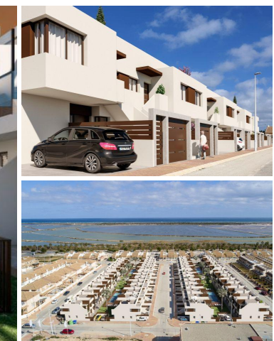
RESIDENCIAL OBRA NUEVA CON PISCINA COMUNITARIA!!!

Este residencial se sitúa a menos de 1km del Parque Natural de las Salinas de San Pedro del Pinatar. Todas las viviendas cuentan con 2 dormitorios y 2 baños, uno de ellos en suite.