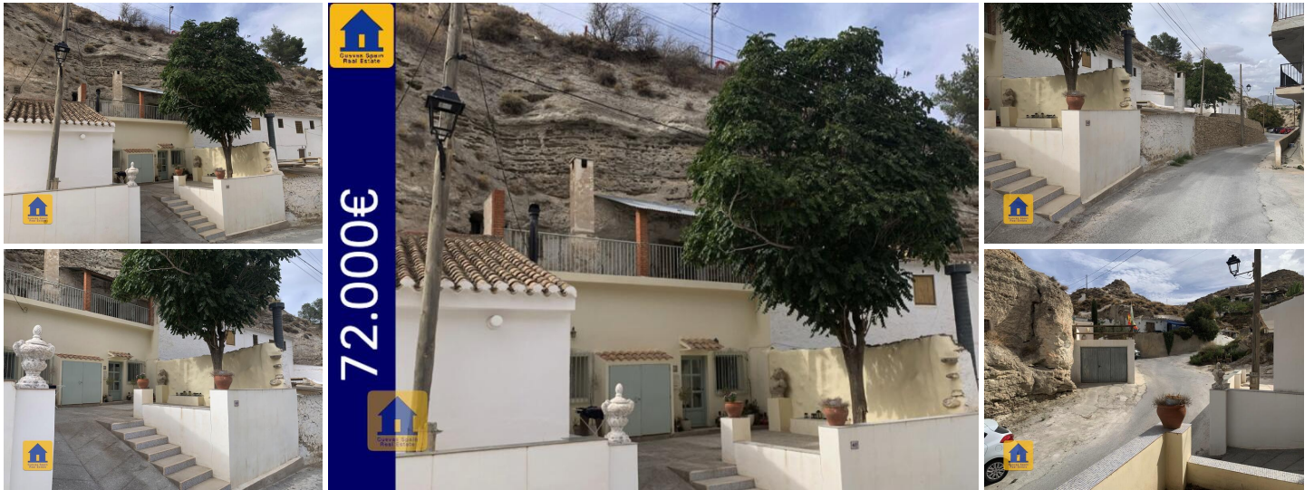
Cueva Tony en Galera

Esta cueva Galera está bellamente renovada en un estilo urbano moderno. La propiedad tiene un amplio patio con un árbol de sombra y plaza de aparcamiento. La cueva tiene una sala de estar, cocina, despensa, dormitorio principal, baño, una habitación de invitados / oficina y un armario. Arriba hay 2 habitaciones sin reformar y una gran terraza cubierta, con potencial para ser un encantador apartamento.