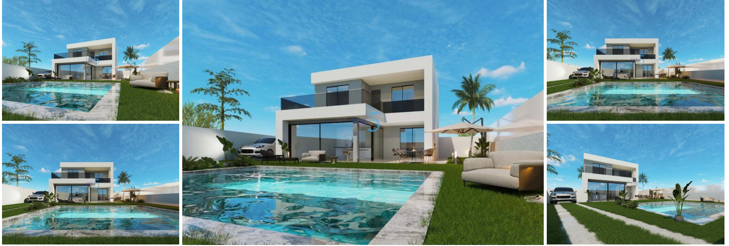
VILLA DE OBRA NUEVA EN SAN PEDRO DEL PINATAR

Hermosa villa de obra nueva de dos niveles han sido cuidadosamente diseñados para proporcionar el perfecto espacio de vida contemporánea privada individual, con puertas correderas de cristal doble completo que se abren directamente a una gran terraza con piscina privada jardines cerrados con aparcamiento fuera de la carretera. «SOL TODO EL DÍA» con zona de terraza en la primera planta para disfrutar del sol durante todo el día ... Situado en una zona residencial céntrica y establecida a sólo 10 minutos a pie de las playas de San Pedro del Pinatar. Esta parcela orientada al sur se encuentra en una zona residencial a sólo 25 minutos de la ciudad de Cartagena y a 30 minutos de la nueva Covera (Aeropuerto Internacional de Murcia).