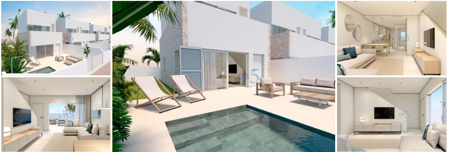
VILLA DE OBRA NUEVA EN TORRE DE LA HORADADA

Complejo residencial de obra nueva de bungalows y villas en Torre de la Horadada a tan solo 450m de la playa.