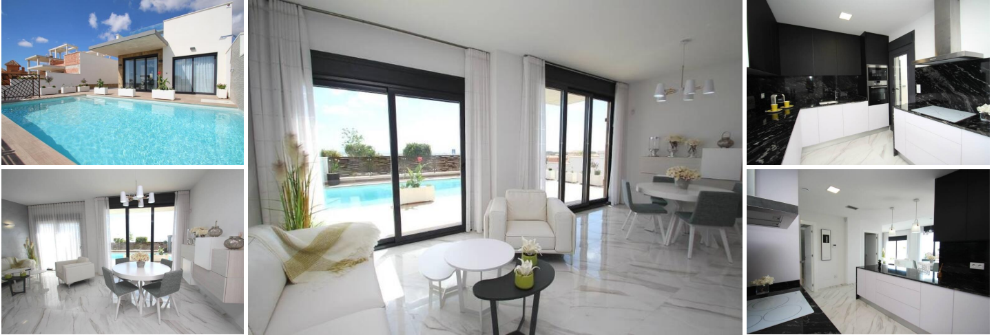
Chalet de nueva construcción en Orihuela Costa

¿Quieres disfrutar de unas vacaciones exclusivas cerca del mar? Imposible no caer rendido a este ultramoderno chalet en Orihuela Costa de 2 dormitorios, 2 baños, piscina privada, jardín y extras de lujo, según las preferencias personales. Su delicada infraestructura se integra con la naturaleza proporcionando un entorno tranquilo y aislado.