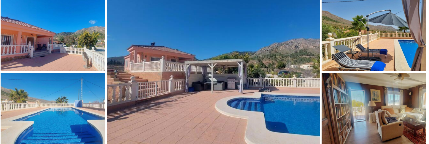
Casa de Campo en La Romana