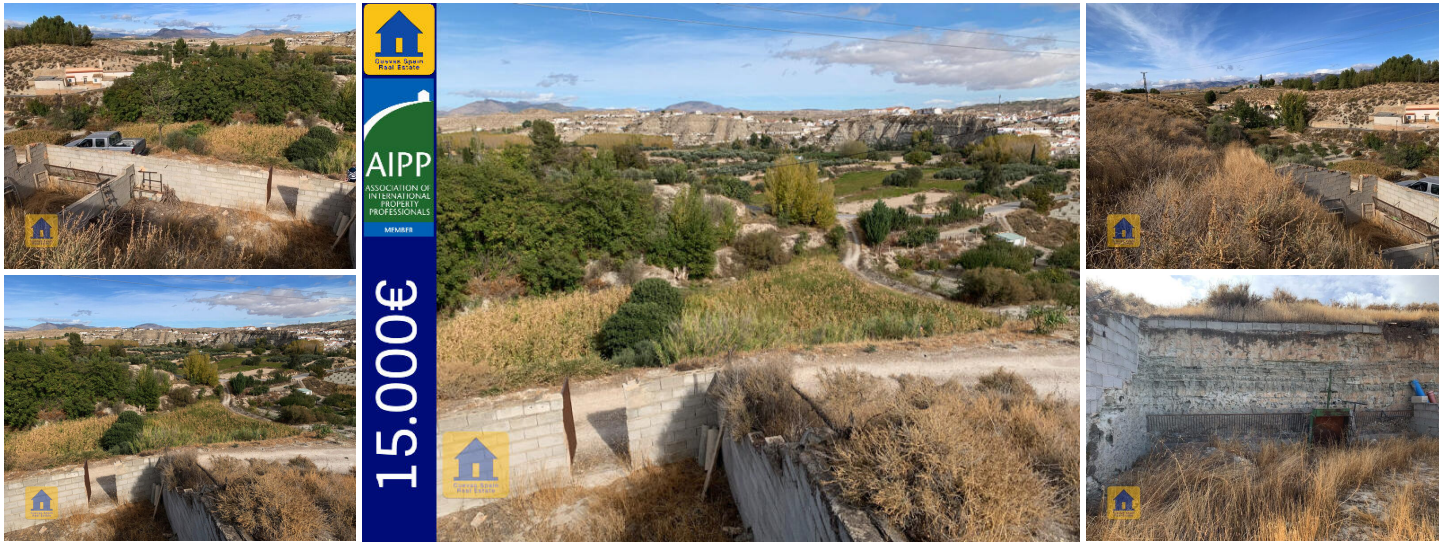
Cueva Mari Carmen Castillejar

Pequeña casa cueva para reformar con fantásticas vistas, a tan sólo 1km del pueblo de Castillejar. El acceso es bueno e incluye un camino de tierra de unos 100 m para llegar a la propiedad. La orientación es noreste y da a las colinas circundantes y al pueblo. El agua y la electricidad están en la puerta tan fácil de conectar. La cueva puede transformarse y ampliarse con una puerta adicional o una ventana. El patio es lo suficientemente grande como para tener una plaza de aparcamiento o un pequeño jardín privado.