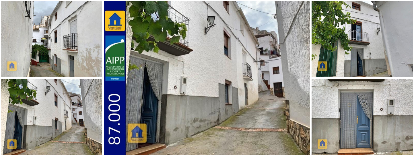
Casa de pueblo loles castril

Gran casa de pueblo de carácter en el centro del impresionante pueblo de Castril. Esta casa fue construida en 1919 y se encuentra en una calle estrecha y sinuosa de adoquines. La calle tiene acceso para vehículos solo para descarga. La casa es de 3 plantas con amplias escaleras, un gran rellano en cada piso y un patio en la parte trasera de la propiedad.