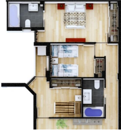
CUBIERTA CON TERRAZAS