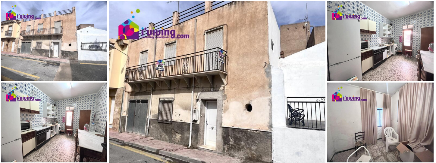
Casa en Calle Augusto Barcia.