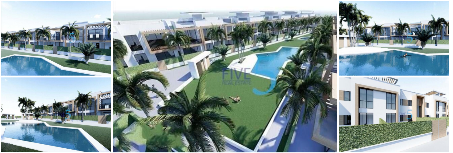
COMPLEJO RESIDENCIAL DE OBRA NUEVA EN ORIHUELA COSTA

Urbanización vallada de 40 apartamentos de 2 y 3 dormitorios, planta baja con jardín privado, planta alta con solárium privado, todos con acceso directo a la gran piscina y jardines comunitarios para que usted y su familia disfruten.