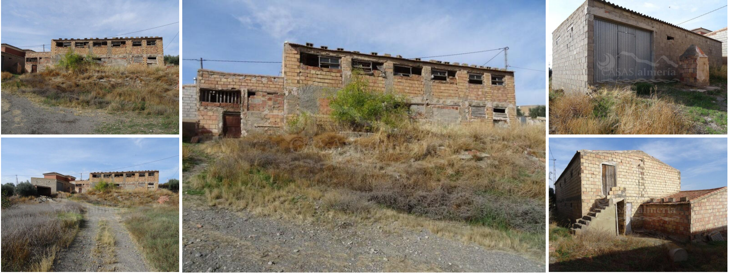
Almacén y nave en Santa María de Nieva.

El almacén se encuentra dado de alta en el catastro como vivienda de 110 m 2 .