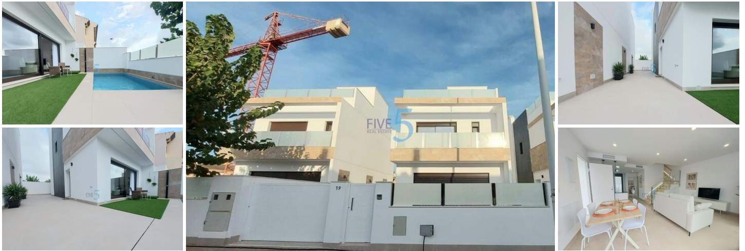
VILLAS DE OBRA NUEVA EN SAN PEDRO DEL PINATAR

Villas modernas de nueva construcción situadas cerca del centro de San Pedro del Pinatar.