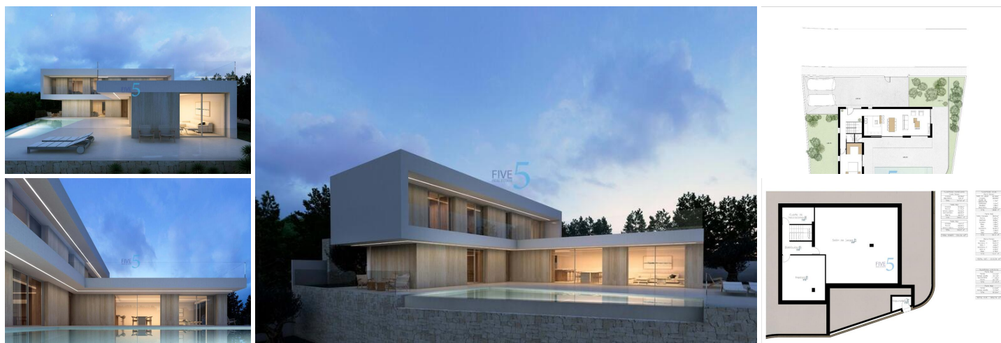
VILLA DE OBRA NUEVA CON VISTAS AL MAR EN BENISSA

Proyecto de Obra Nueva en la costa de Benissa situado muy cerca de la preciosa playa de La Fustera y de comercios, restaurantes y servicios, todo ello a menos de 300m aproximadamente.