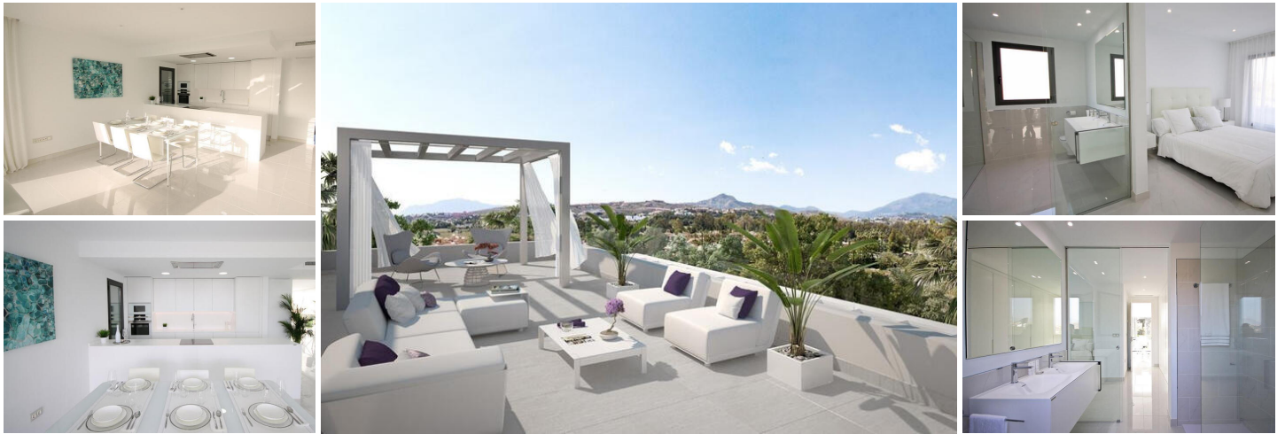
Apartamento de 2 dormitorios en Nueva Milla de Oro

Ubicada entre Marbella y Estepona, en el corazón de Atalaya Alta, este apartamento se encuentra en uno de los enclaves más increíbles, totalmente rodeado de naturaleza, pero a escasos minutos de todos los servicios necesarios, restaurantes, playas, campos de golf, colegios, etc. Es un lugar idílico donde respirar aire puro y tranquilidad, disfrutando de un entorno natural sin renunciar al lujo ni a los servicios que ofrece la zona.