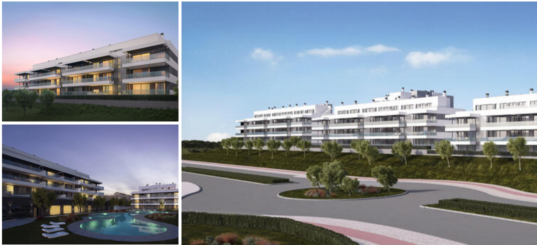
Apartamento de 2 dormitorios en La Cala de Mijas

Complejo de apartamentos único y áticos pensados para disfrutar y sentir el día día de un entorno privilegiado, espacios abiertos con mucha luz para el entretenimiento de la familia y disfrute al aire libre con la mayor comodidad dentro de cada casa.