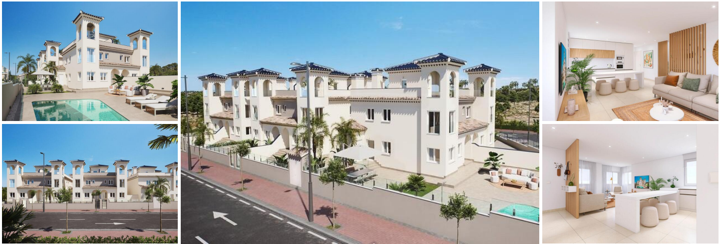
Exklusive Doppelhaushälften und Villen in Bigastro, Alicante