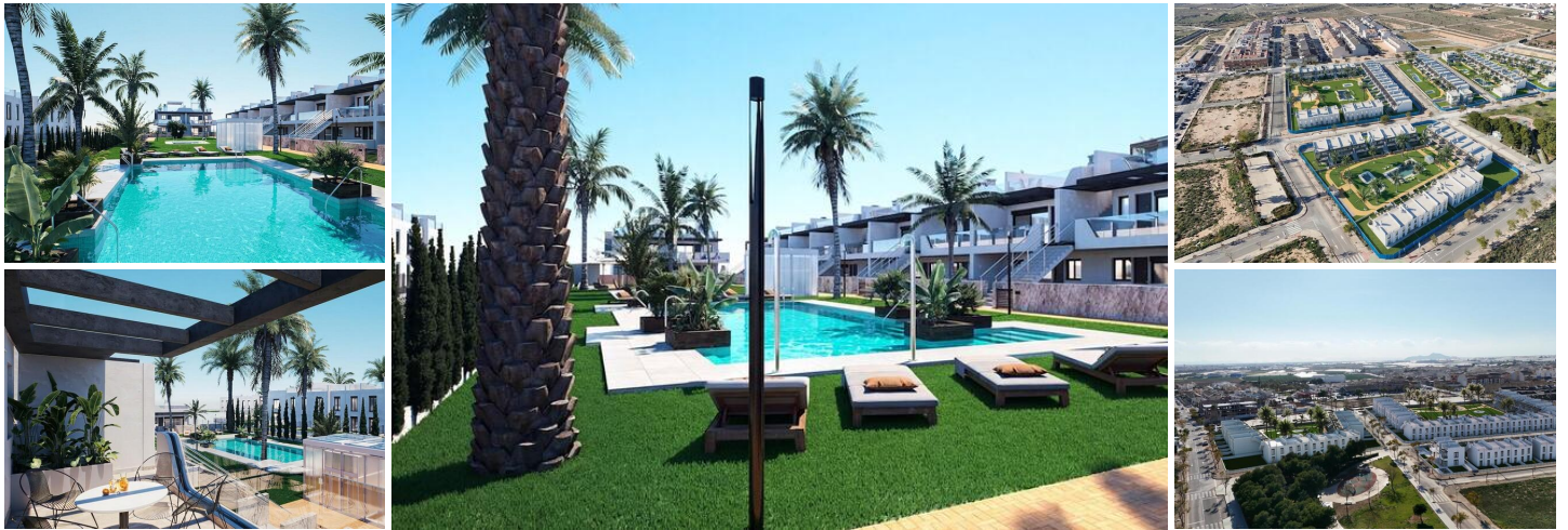
Neubau-Bungalows mit Garten oder Solarium in Strandnähe in Pilar de la Horadada

Moderne mediterrane Häuser, die auf Komfort ausgelegt sind