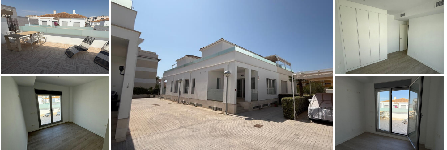
Moderne Quad-Villa in Los Dolses

Diese wunderschön gestaltete Quad-Villa im modernen Stil ist eine fantastische Gelegenheit in der begehrten Gegend von Los Dolses, Orihuela Costa. Nur wenige Minuten entfernt von allen Annehmlichkeiten, lokalen Restaurants, Straßenmärkten, Golfplätzen und dem Strand sowie dem beliebten Zenia Boulevard Einkaufszentrum.