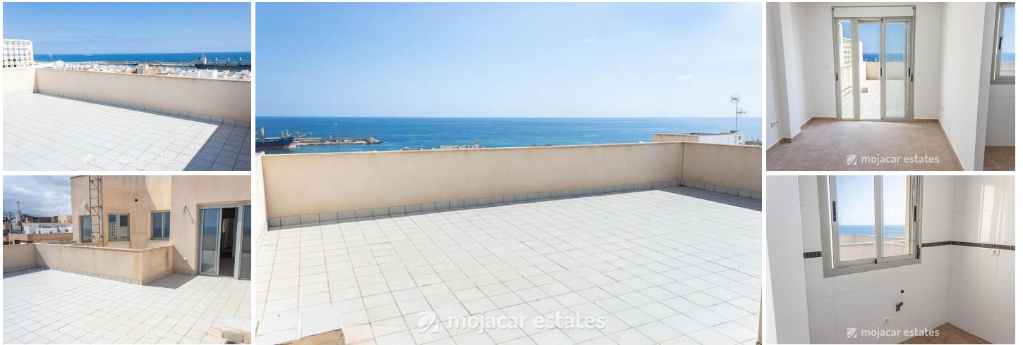
Penthouse zum Verkauf in Garrucha, Almería mit Meerblick und großer privater Terrasse

Ein wirklich besonderes Penthouse steht jetzt zum Verkauf und befindet sich im dritten Stock eines modernen Gebäudes aus dem Jahr 2006, komplett mit Aufzug. Bemerkenswerterweise wurde das Grundstück nie bewohnt oder genutzt, was eine seltene Gelegenheit bietet, ein brandneues Zuhause im Herzen von Garrucha zu erwerben.