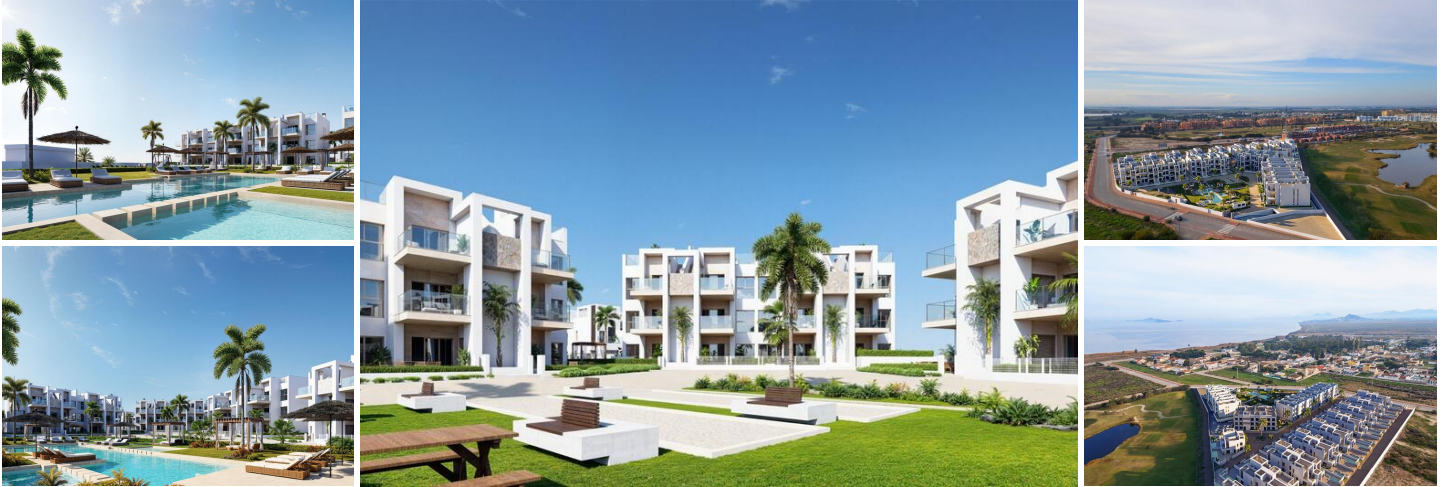
Neubau-Resort-Apartments in La Serena Golf-Los Alcazares in Strandnähe