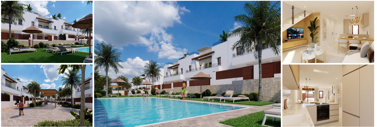
Neubauwohnungen im Vistabella Golf Resort, Orihuela