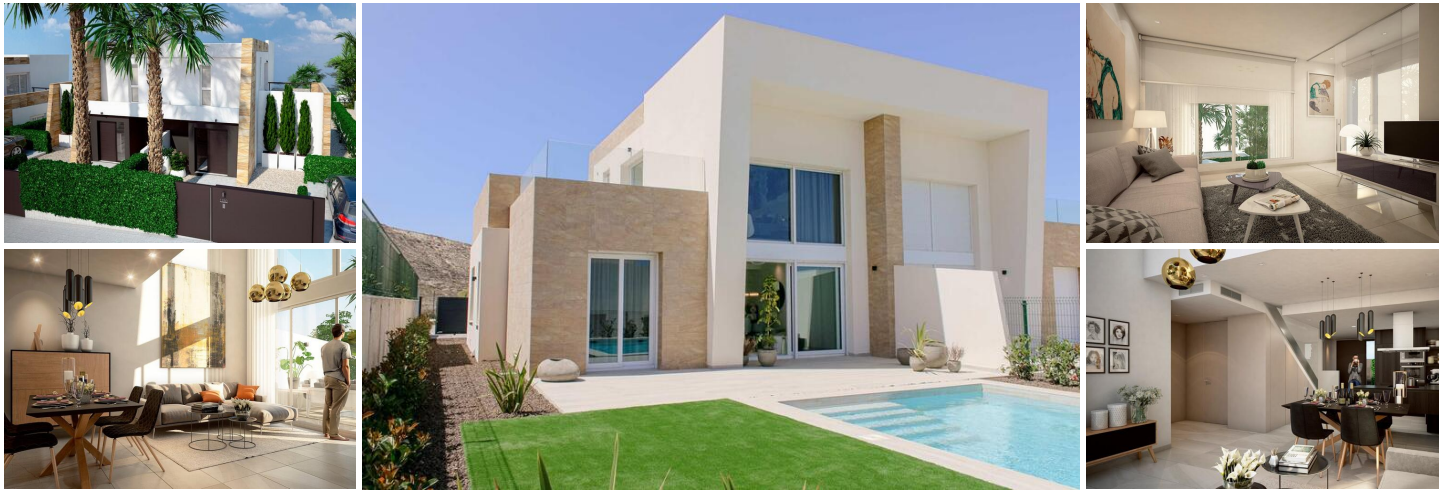
Neubau-Doppelhaushälften mit privatem Pool im La Finca Golf Resort, Algorfa