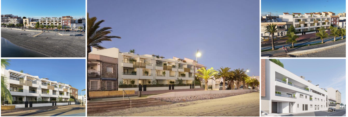
NEUBAU EINER WOHNANLAGE IN ERSTER LINIE IN SAN PEDRO DEL PINATAR

Lo Pagan liegt am bezaubernden Mar Menor und ist eine Stadt in Murcia, die eine nahtlose Mischung aus natürlicher Schönheit und kulturellem Reichtum bietet. Sie ist der perfekte Zufluchtsort für alle, die eine ruhige Oase suchen. Lo Pagan ist vom Flughafen Alicante aus in nur 57 Minuten zu erreichen und lädt dazu ein, sich in diesem idyllischen spanischen Küstenort zu entspannen, ihn zu erkunden und schöne Erinnerungen zu schaffen.