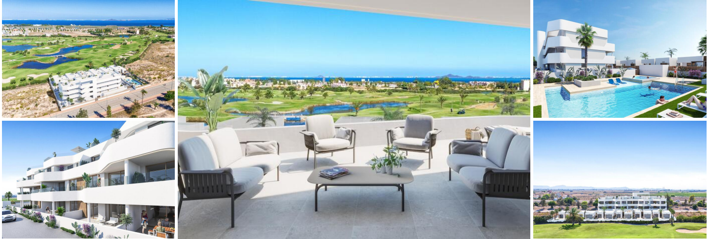
Neubau-Wohnkomplex in Los Alcázares