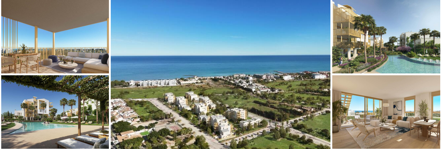
NEUBAU WOHNANLAGE IN EL VERGEL

Neubau-Wohnanlage mit Wohnungen und Penthäusern mit 1, 2 und 3 Schlafzimmern in El Verger, die als kompakte Strukturen konzipiert wurden, eine Antwort auf das ständige Streben der Architekten und Designer nach Effizienz in der Entwicklung. Diese Entscheidungen, die sich auf die verschiedenen Schlüsselpunkte des Wohngebiets verteilen, sorgen dafür, dass Ihr Zuhause sowohl im Winter als auch im Sommer die richtige Temperatur hat.