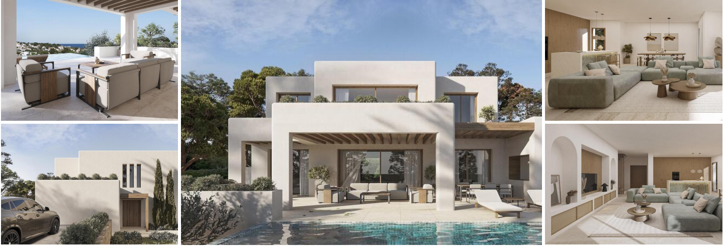
Villa mit Meerblick und ibizenkischem Charme in La Fustera, Benissa

Diese atemberaubende, neu erbaute Villa verbindet die Eleganz moderner Architektur mit der Wärme und dem Charakter des ibizenkischen Designs. Sie befindet sich in der begehrten Gegend von La Fustera (Benissa Costa) und bietet einen Panoramablick auf das Meer. Der Strand, Supermärkte, Restaurants und andere wichtige Dienstleistungen sind nur wenige Minuten entfernt.