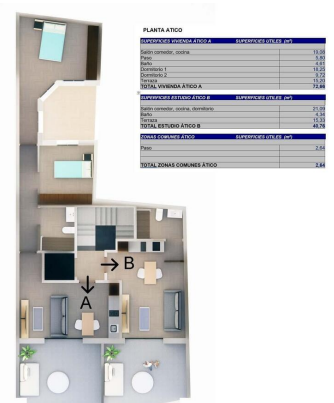
Áticos Estudio B y Vivienda A