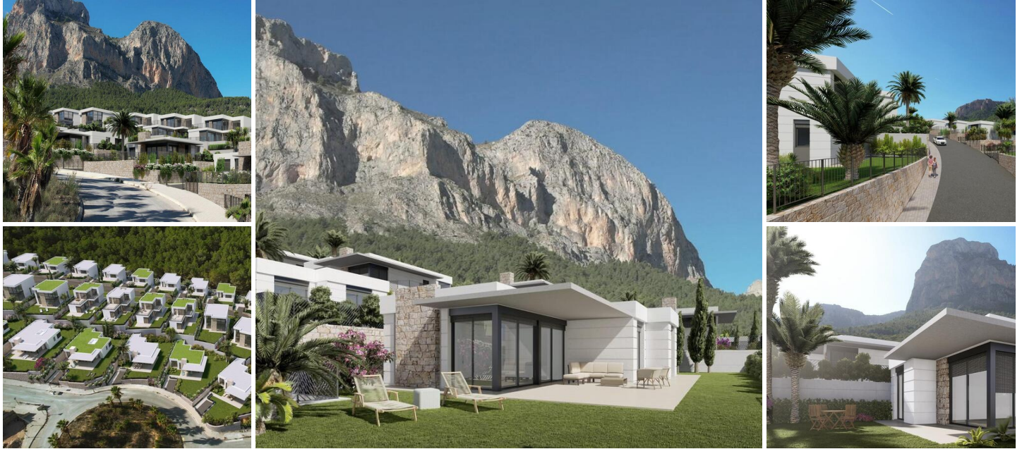
Neubau Villen in Polop, Alicante