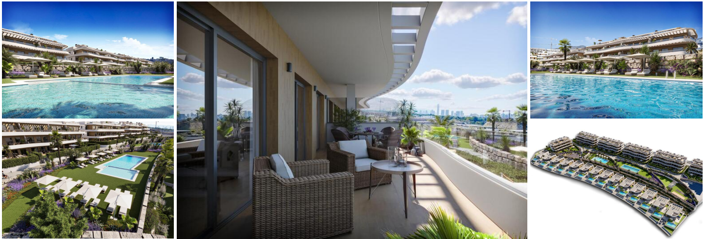
Luxuriöse Neubauwohnungen und Villen mit Panoramablick auf das Meer in Finestrat