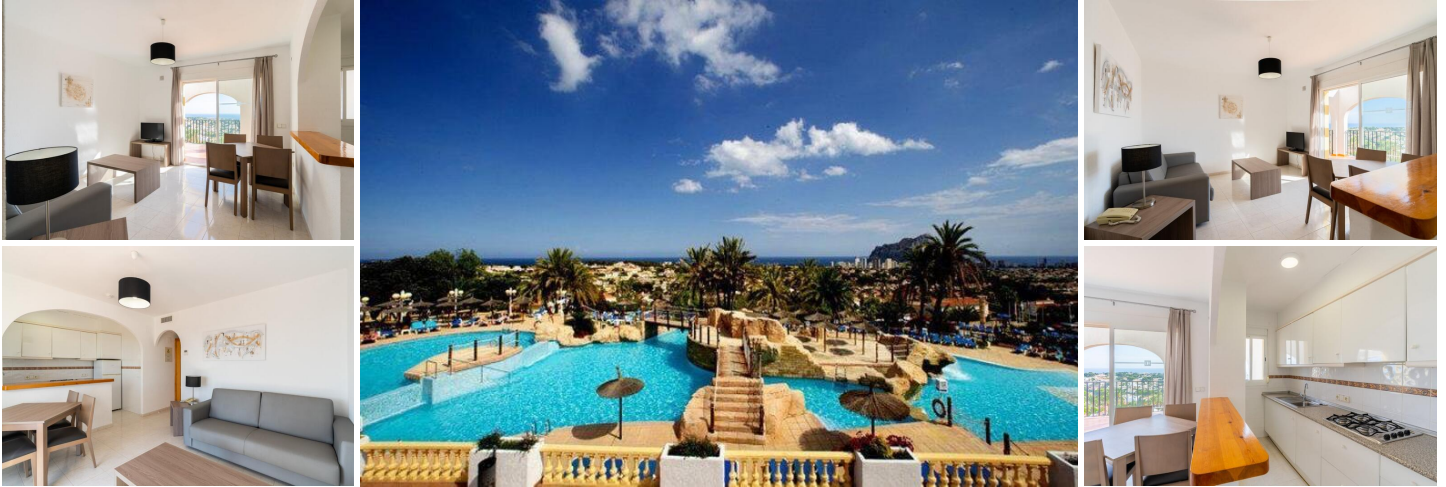
OBERGESCHOSS BUNGALOW WOHNUNGEN IN CALPE

Schöne Bungalows mit 1 Schlafzimmer, 1 Badezimmer, amerikanische Küche mit Wohnzimmer, Einbauschränke und Terrasse.