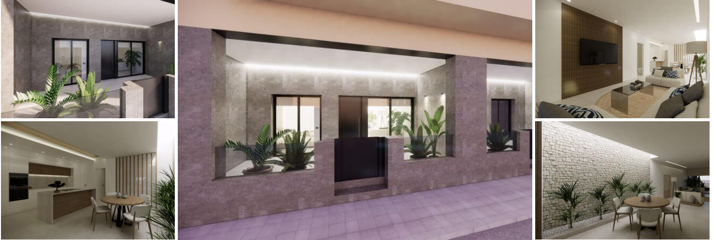
Moderne Neubauwohnungen in Catral