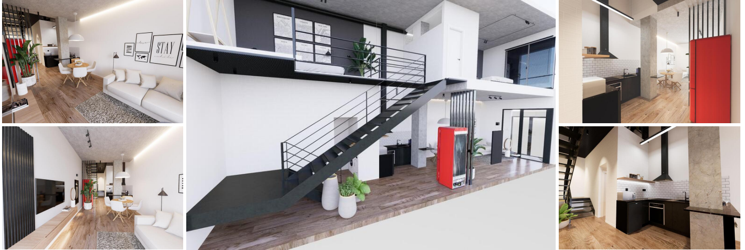
Moderne Duplex-Loft-Wohnungen im Herzen von Alicante