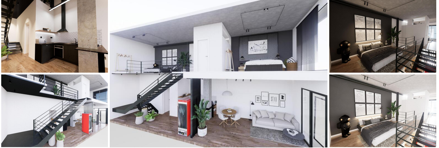
Moderne Duplex-Loft-Wohnungen im Herzen von Alicante