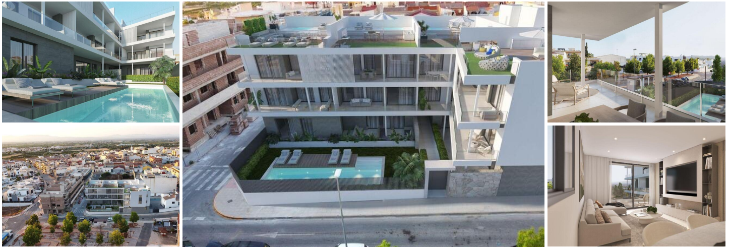
Neubauwohnungen in Benijofar in zentraler Lage