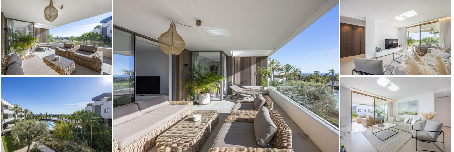
Meerblick Luxus Boutique development in Benahavis / Marbella

Erleben Sie ein außergewöhnliches Apartment mit Meerblick und Bergblick und 3 Schlafzimmern in diesem exklusiven Boutique-Development mit nur 24 Wohnungen, gelegen im Gebiet von Benahavis — ideal nur 10–15 Minuten mit dem Auto von Marbella, Puerto Banús und Estepona entfernt. Das 2021 erbaute Projekt entspricht den neuesten technischen Standards und verbindet zeitgenössische Eleganz mit einem stilvollen mediterranen Lebensstil – ein Wohnumfeld der Extraklasse.