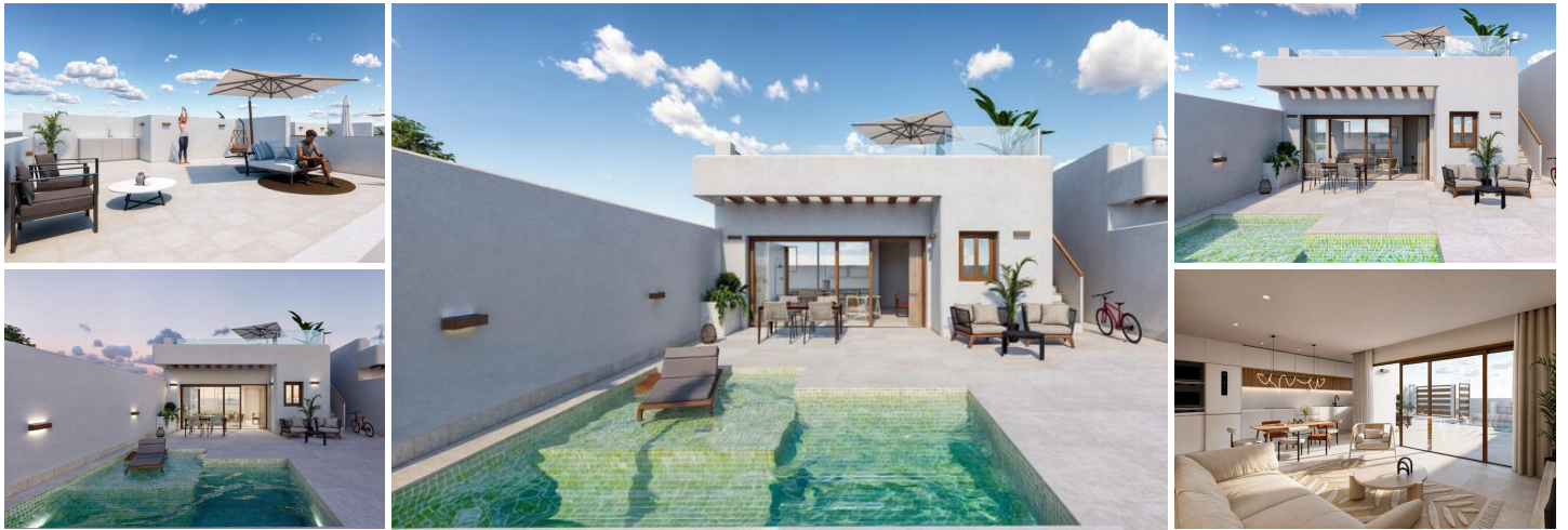
Moderne Neubau-Villen in Torre-Pacheco, Murcia

Entdecken Sie die perfekte Mischung aus modernem Design, Komfort und Lage mit diesen atemberaubenden Neubauvillen in Torre-Pacheco, Murcia.