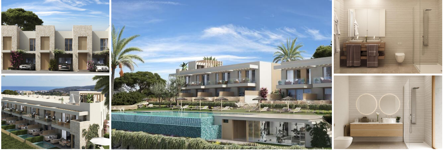
Neubau-Reihenhäuser mit Meerblick zum Verkauf in Manilva

Zwischen Estepona und Sotogrande, in der zunehmend beliebten Gegend von Manilva, entsteht dieses spannende Neubauprojekt mit 20 modernen Reihenhäusern. Die stilvoll gestalteten Häuser bieten einen zeitgemäßen Wohnkomfort sowie spektakuläre Ausblicke auf das Mittelmeer und die grüne Umgebung. Die Fertigstellung ist für das vierte Quartal 2027 geplant – eine hervorragende Gelegenheit für Frühkäufer.