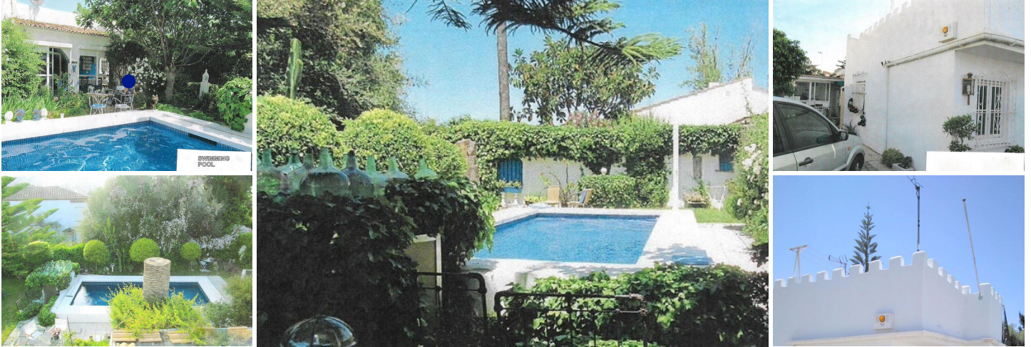
Freistehende Villa zum Verkauf – Alhaurín el Grande, Inland von Málaga

3 Schlafzimmer | 3 Badezimmer | Wohnfläche 112 m 2 | Grundstück 527 m 2