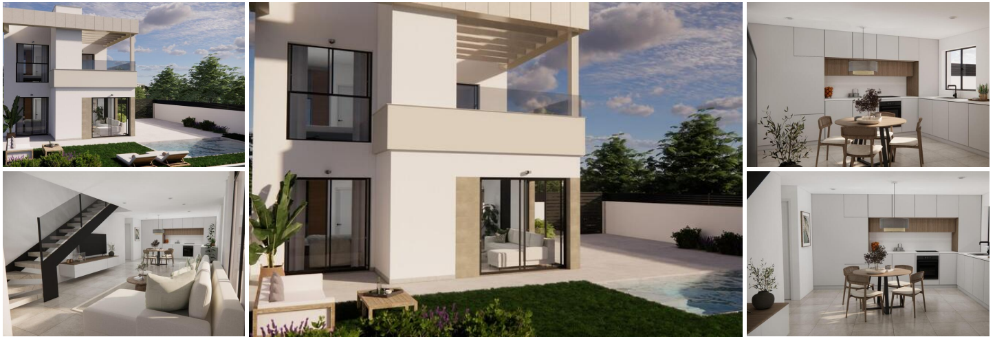
Moderne Villen mit privatem Pool im Vistabella Golf Resort, Orihuela