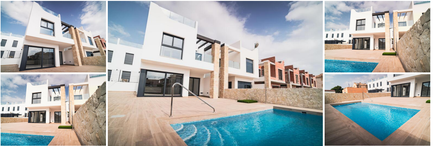
Neubau von Bungalows und Villen in Pilar de la Horadada