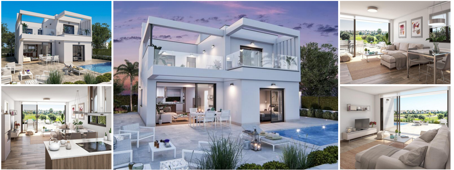
NEUBAU GRONLINE VILLA IM RODA GOLF COURSE RESORT

Neubau Eckgrundstück Luxusvilla mit privatem Pool und Parkplatz auf dem Grundstück.