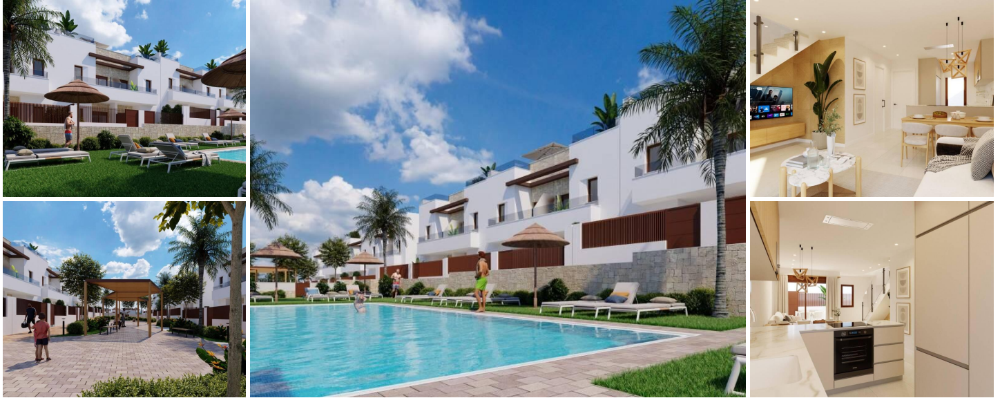
Neubauwohnungen im Vistabella Golf Resort, Orihuela

Exklusive Wohnsiedlung in bester Golfage