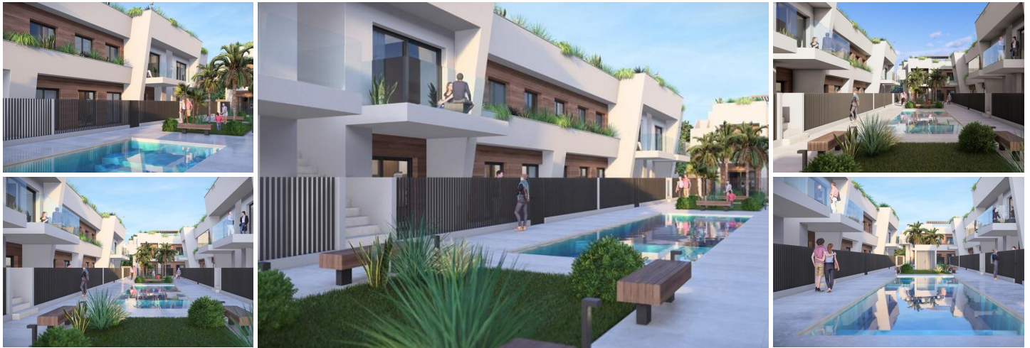
Neubau Häuser in Torre-Pacheco, Costa Cálida