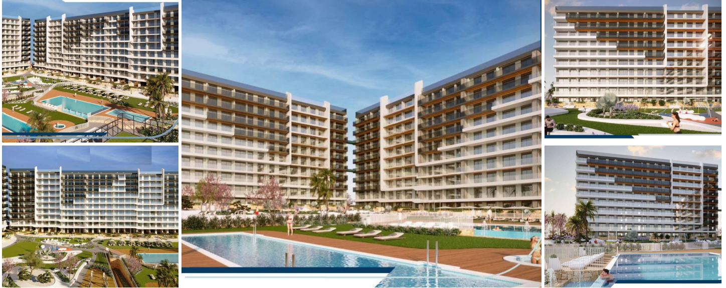
NEU GEBAUTE WOHNANLAGE IN PUNTA PRIMA

Neubau-Wohnanlage mit 220 Wohnungen in Punta Prima, Torrevieja.