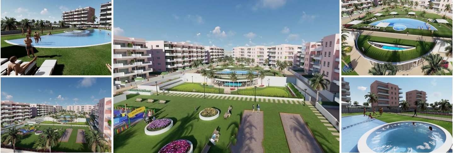
NEUBAU WOHNANLAGE IN EL RASO, GUARDAMAR DEL SEGURA

Neubau einer Wohnanlage mit modernen Apartments in El Raso, Guardamar del Segura!